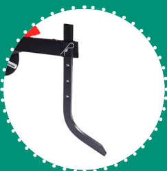
ÉPERON à 4 ajustements