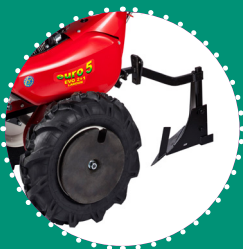
KIT DE LABOUR CLASSIC roues 5.00-10" + axes fixes 2 ballasts roues 20 kg chacun ballast frontal 15 kg charrue classique