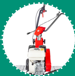
GUIDON réglable verticalement et latéralement