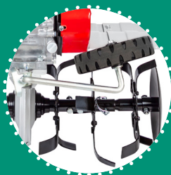
ROUE DE TRANSPORT frontale à levage rapide