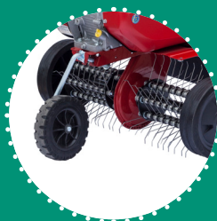
AÉRATEUR à ressorts, 50 cm