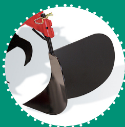
BUTTEUR à ailes fixes