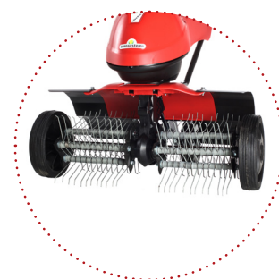
ARIEGGIATORE a molle per prato, larghezza lavoro 50 cm