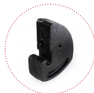
ZAVORRA frontale con attacco rapido, 4 Kg