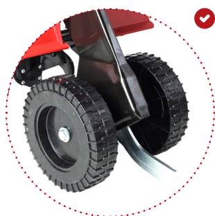
Ruotino trasporto doppia ruota in plastica su sperone fisso