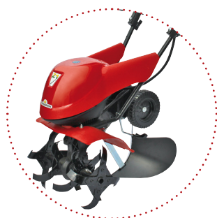
RINCALZATORE ad ali fisse con sistema di attacco rapido