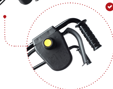
Accensione elettrica con comando di sicurezza