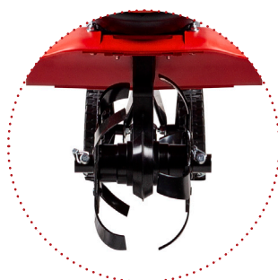
FRESA 16 da montare su assi, larghezza lavoro 16 cm